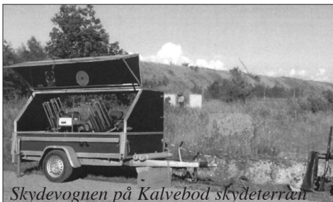
Skydevognen på Kalvebod skydeterræn